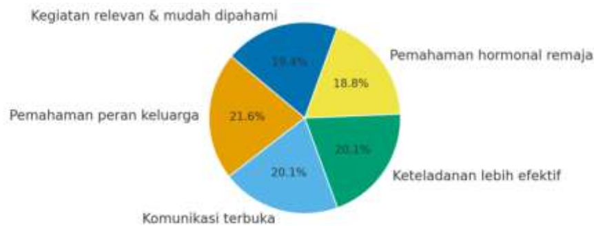
Gambar 3. Diagram Pie Persepsi Positif Peserta terhadap Materi Pengabdian

Temuan ini menunjukkan bahwa kegiatan edukasi berbasis empati mampu memperkuat kesadaran peserta terhadap pentingnya komunikasi terbuka dan pengasuhan yang berlandaskan kasih sayang. Hal ini sejalan dengan hasil penelitian Santrock (2021) yang menyatakan bahwa komunikasi hangat dan suportif antara orang tua dan anak remaja berperan penting dalam menurunkan risiko stres dan konflik keluarga.