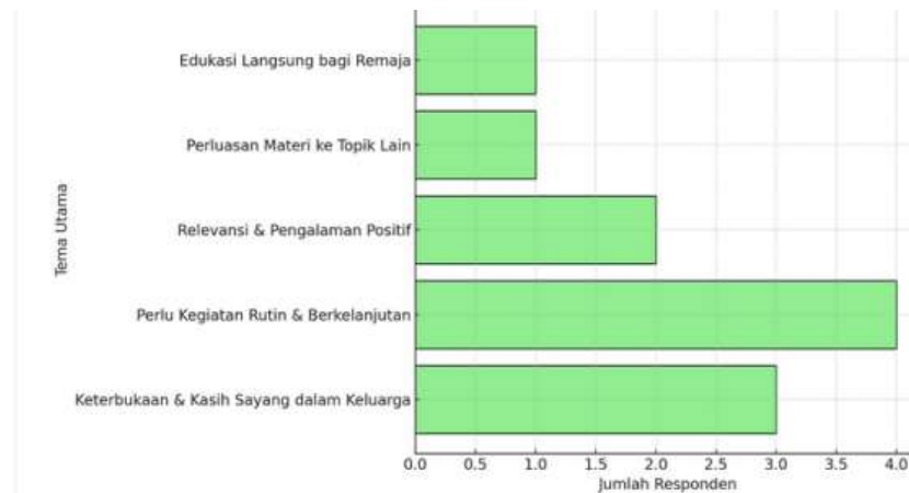
Gambar 4. Histogram Temuan Kualitatif dari Tanggapan Peserta

“Sebaiknya kegiatan seperti ini diadakan lebih sering.”