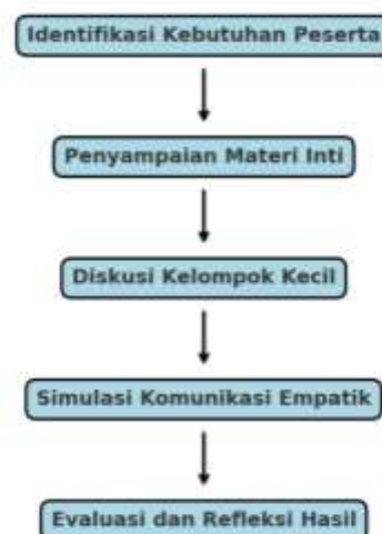
Gambar 1. Alur pelaksanaan PKM